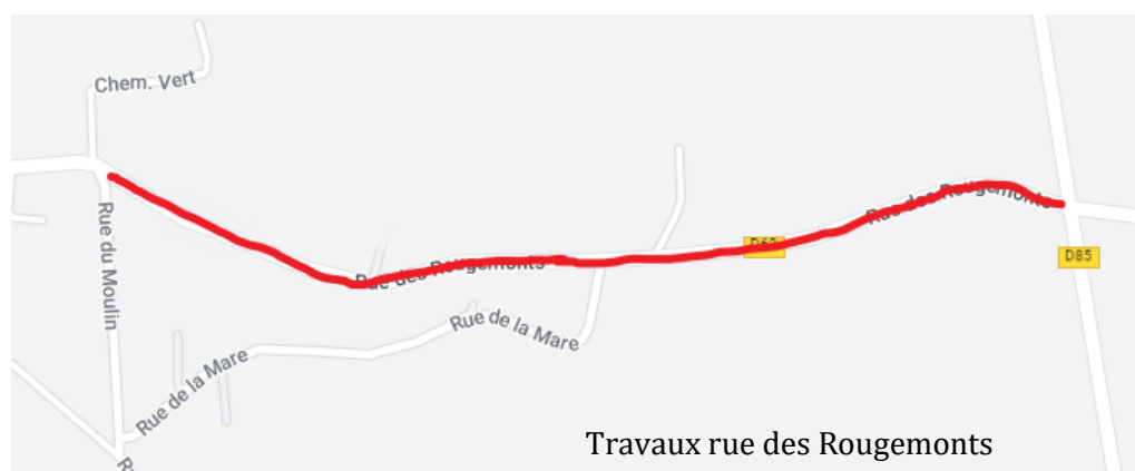
Travaux rue des Rougemonts

Monsieur le Maire et son conseil remercient de leur compréhension toutes les personnes concernées par les désagréments pendant la durée des travaux.