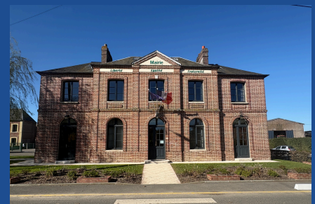
Mairie de Servaville-Salmonville